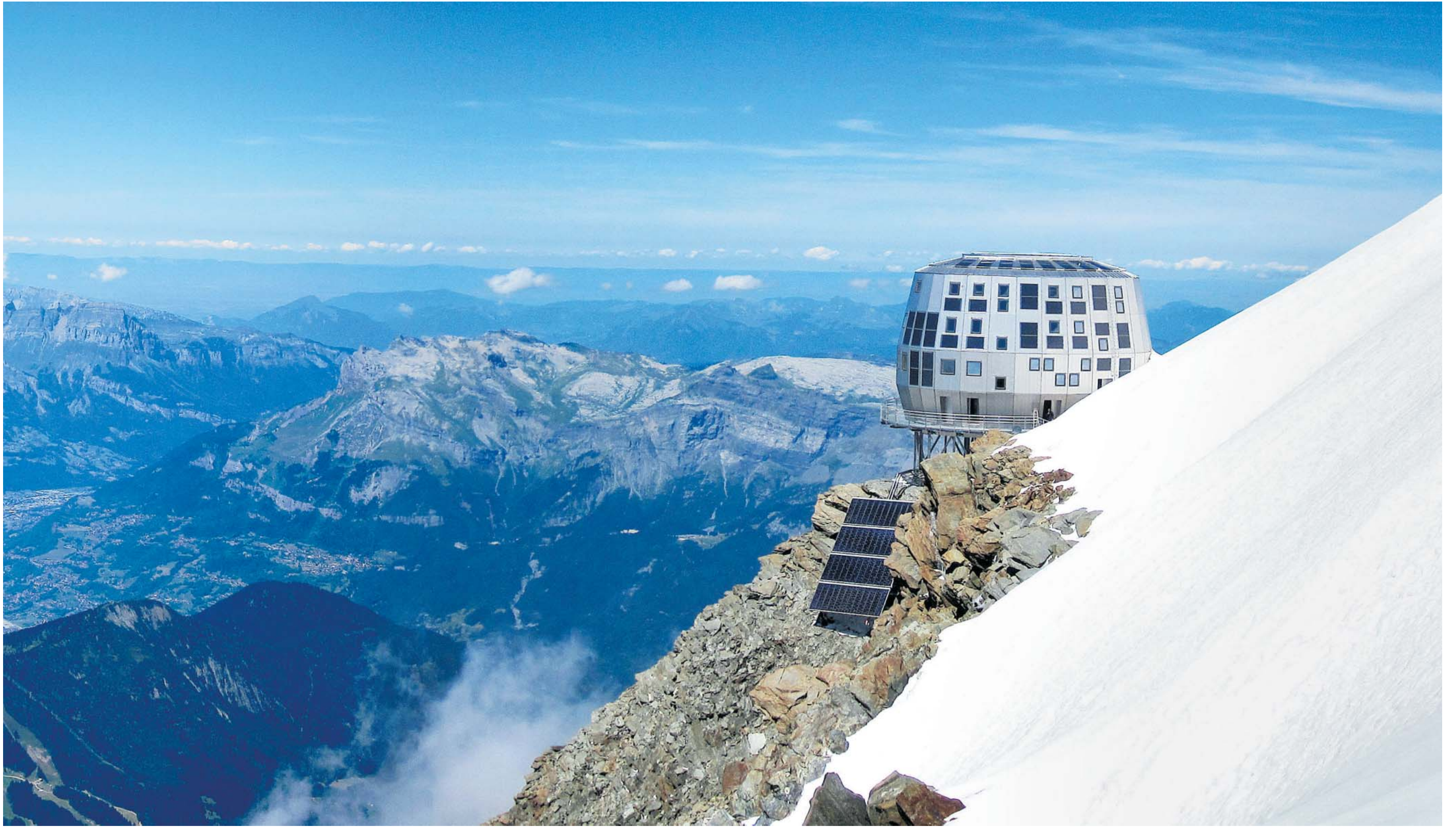
Futuristischer Bau am Mont Blanc: das Refuge du Goûter