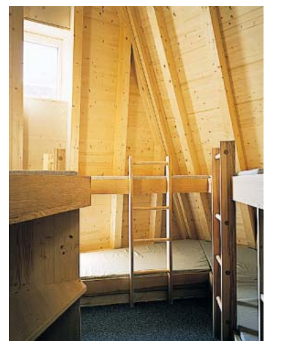
Spartanisch, doch hochgedämmt und gut gebettet