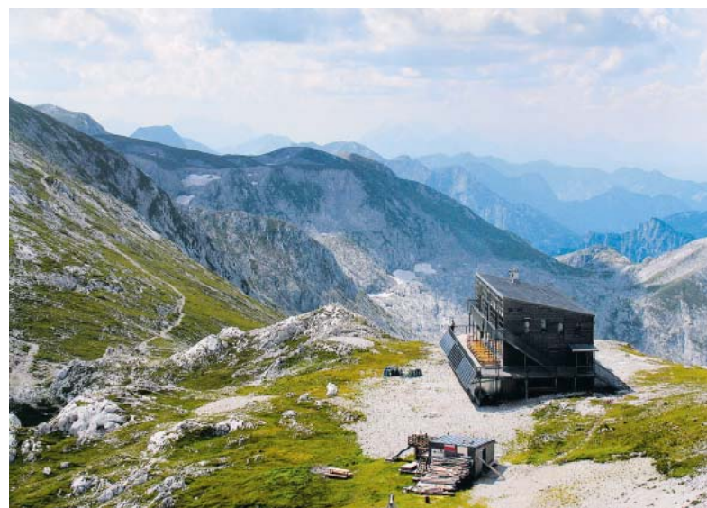
Im Winter ungenutzt: das Schiestlhaus in Österreich