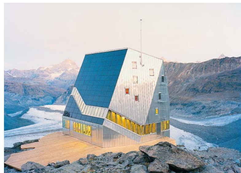
Metallisch blinkender Bergkristall: die Neue Monte Rosa-Hütte